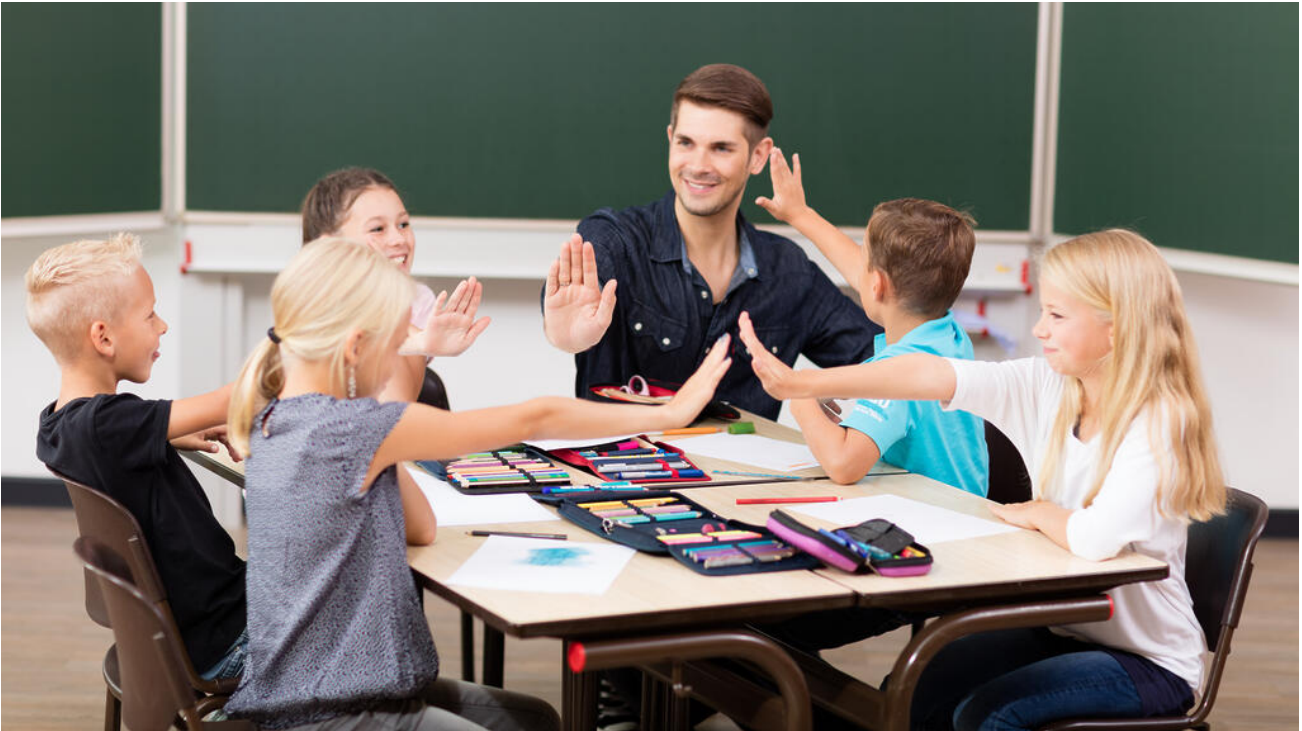
Förderlehrkraft wird man über den Weg einer Ausbildung

An allgemeinbildenden Schulen werden auch Förderlehrkräfte eingesetzt. In Bezug auf die Ausbildung zur Förderlehrkraft haben wir folgende Informationen bereitgestellt: