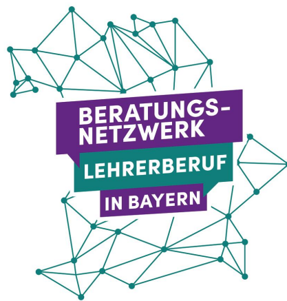
Logo des Beratungsnetzwerks „Lehrerberuf in Bayern“

Sie interessieren sich für den Lehrerberuf, haben aber noch Fragen? Das „Beratungsnetzwerk Lehrerberuf in Bayern“ steht Ihnen ab sofort zur Verfügung, um Sie rund um Ihren individuellen Weg in die Tätigkeit als Lehrerin und Lehrer zu beraten.